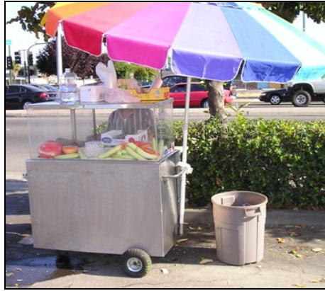
Vendedor sin Permiso