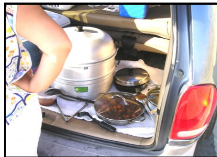
Un vendedor sin permiso vendiendo fuera de su auto